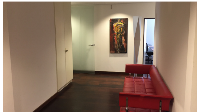
AWB Räumlichkeiten in Lugano

In Zusammenarbeit mit der Tessiner Handelskammer haben wir ein Tool entwickelt, welches erlaubt, die finanziellen und ökonomischen Indikatoren zu überwachen. Im Fokus stehen diejenigen Werte, welche einen direkten Einfluss auf die Entwicklung des Unternehmenswertes haben. Über dieses wie auch über andere Sachgebiete publizieren wir regelmässig Artikel in Fachzeitschriften, um auf unsere Erworbenen Erfahrungen und Spezialkenntnisse hinweisen zu können.