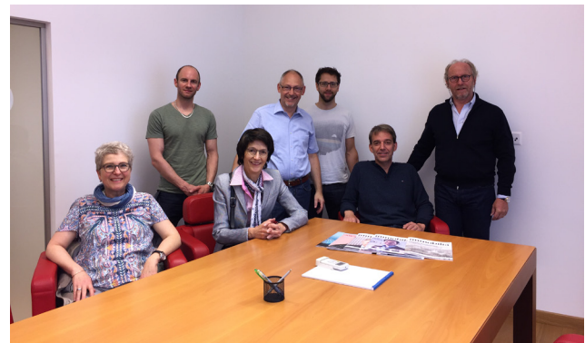
AWB-interner Workshop in Lugano